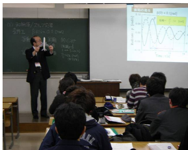
模型を使って計算結果を説明している様子

授業終了後に担当教員の授業への配慮が伝わっているか、授業内容の理解にプラスになっているかを中心に聴講者に問合せた。いただいた意見を以下に示す。