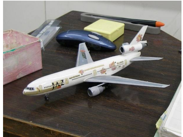
授業の説明に使用している模型

◆効果的であったと思います。さらにイメージをクリアーにするために、例えば、進行方向と機首方向を示す矢印みたいなもの（ボール紙で作るなどして画鋲で刺す）を模型に付けることは可能でしょうか？そのようなすると、横すべり角などを、よりイメージしやすくなるのでは、という気がしました。