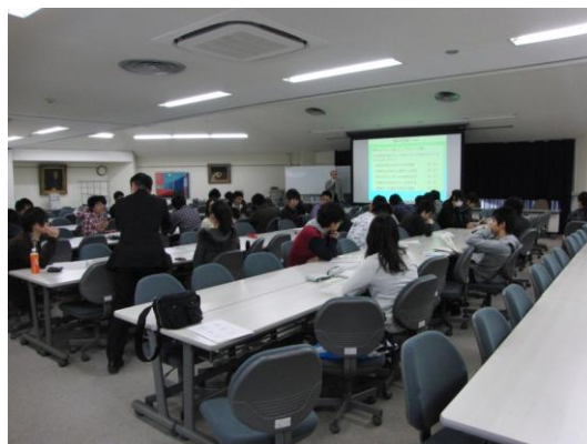
TA 研修会「実験・演習担当」

開催目的: 担当教員の自主的な判断に任せられている TA (ティーチング・アシスタント) の導入教育を実施した。受講学生の履修を援助する技術を高めることを目的とした。今年度も、実験・演習担当と講義・ゼミ担当とに分けて、実施した。TA の確定時期と作業の開始時期を考慮し、2グループに分ける必要があるが、研修内容はほぼ同じとした。