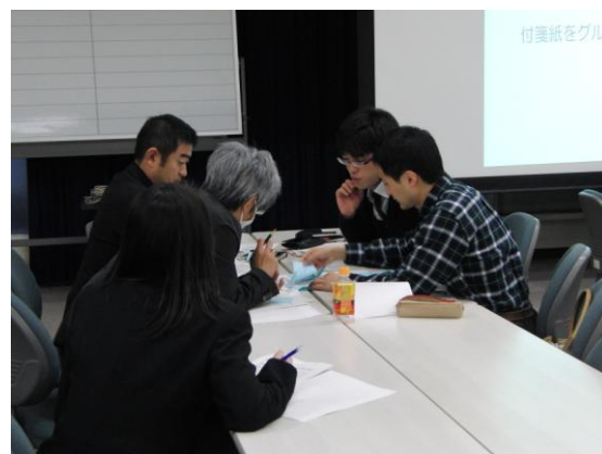
教職学が一体となったワークショップ

成果と課題： アクティブ・ラーニングは今後の大学教育に必要なことであり、大学教育の中で失ってはいけない内容を維持しながら導入しなければならない。その問題点を外部講師から指摘され、形式的な導入だけでなく、内容的な導入を志すことが明確になった。次年度のFD 推進部のテーマとしても取り上げる価値があると判断している。参加者が少なかったことが課題として挙げられ、次年度は参加者増員のための積極的な広報活動を展開する必要がある。